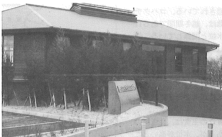
図1. 新旭町水鳥観察センター (センターのパフレットより)

琵琶湖を中心にした4水域、湖南・湖東・湖北・湖西のうち、コハクチョウは湖北と湖西水域に多く越冬する。その要因として考えられることは、琵琶湖西岸の新