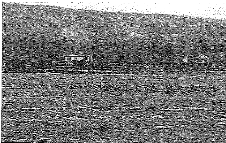
図2. サラブレッドの故郷で越冬するマガン-1.

早朝の日の出と共に、静内川のねぐらから採食地へと向かい、一日中、採食行動をし、日没と同時にねぐらへと帰る。一日の行動は、群れ全体での統一行動である。