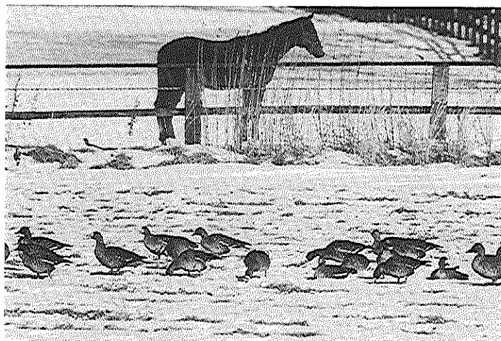
図3. サラブレッドの故郷で越冬するマガン-2.

※1～2シーズンは市街地に隣接した牧場・牧草地。3～5シーズンは海岸線近くの牧場・牧草地。6～8シーズンは、市街地より5～6km奥の牧場・牧草地と数年単位で移動をしている。