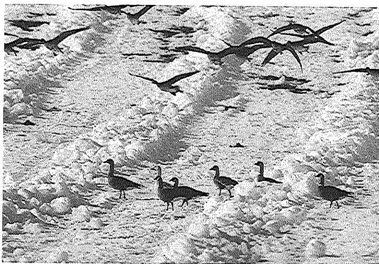
図6. マガン68羽が越冬。うちシジュウカラガン4羽、ハクガン1羽の希少種も含まれた越冬5シーズン。

また、期間のズレはあるものの、シーズン当初より本群としてマガン52羽とシジュウカラガン1羽の53羽、2羽の小群としてオオヒシクイとマガン。更に2月6日以降はハクガンも加わり、併せて4種類のガンが越冬した。中でもオオヒシクイは静内町