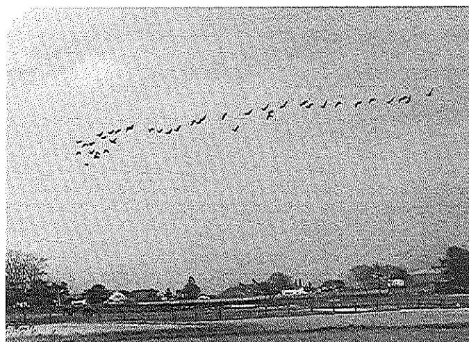
図1. サラブレッドの故郷である越冬地を飛翔するマガン。