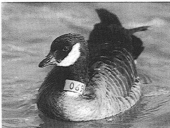
図5. マガン越冬3シーズン目には、エカルマ島で放鳥したシジュウカラガン(0690も越冬した。