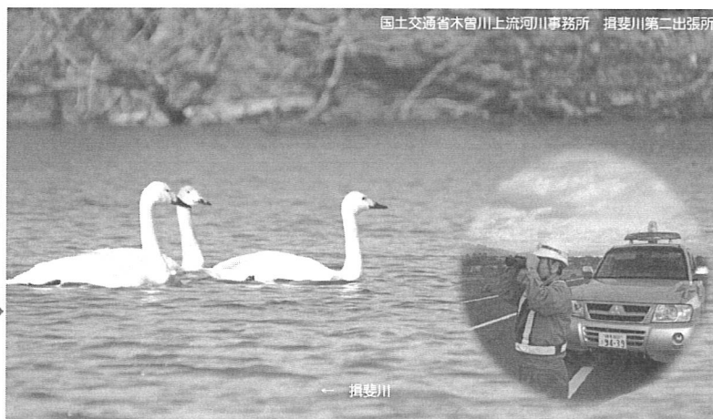
水面で羽根を休めるコハクチョウ = 揖斐川30.6Kp付近(轡之内町塩嶺地先)

(※揖斐川周辺は立ち入り禁止区域内にコハクチョウが入ることもあり、観察できない場合もあります。観察時には立ち入り禁止区域に入らないようにお願いします。)