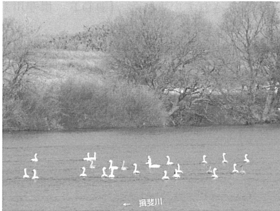
カワウの営巣地付近で水面を泳ぎ回るコハクチョウの群れ 〓 穂之内町塩嶺地先