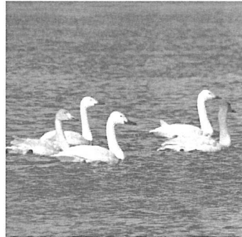
仲睦まじく泳ぐコハクチョウの親鳥と雛鳥 撮影：平成27年1月11日