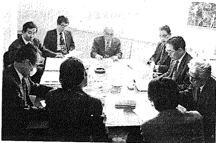
〔 IWRB日本委員会第一回理事会 〕

なお、来日したマッシュューズ局長の講演要旨と、IWRB日本委員会の規約は別稿のとおり。