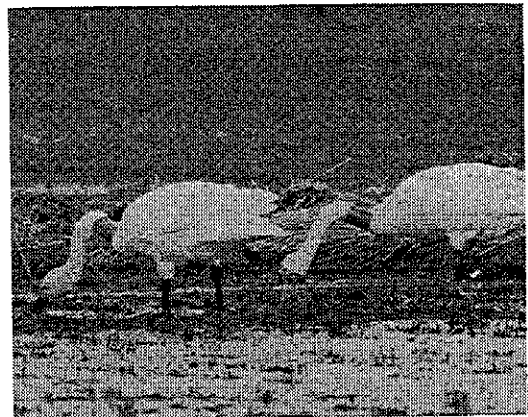
左 009C (赤) 右 006C (赤) [1978. 2. 12 福島潟で撮影] 以上4枚